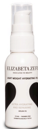
Light Weight Hydration Oil