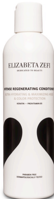
Intense Regenerating Conditioner