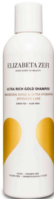
Ultra Rich Gold Shampoo