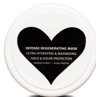
Intense Regenerating Mask