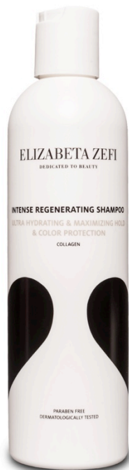
Intense Regenerating Shampoo