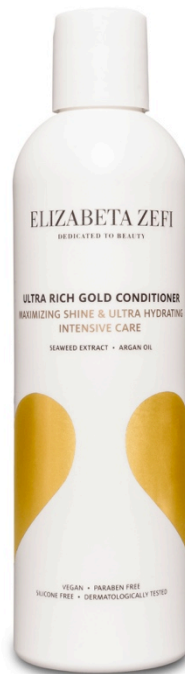
Ultra rich Gold Conditioner