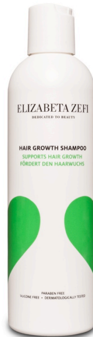
Hair Growth Shampoo