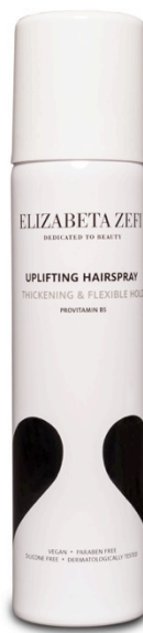
Uplifting Hairspray 75ml