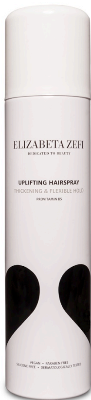
Uplifting Hairspray 300ml