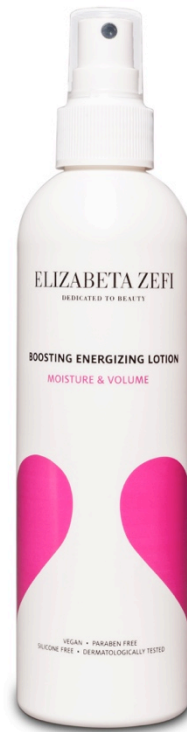
Boosting Energizing Lotion