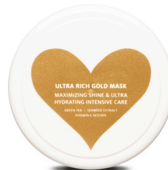
Ultra Rich Gold Mask