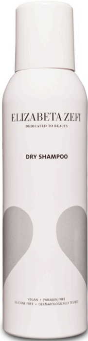
Dry Shampoo 200ML